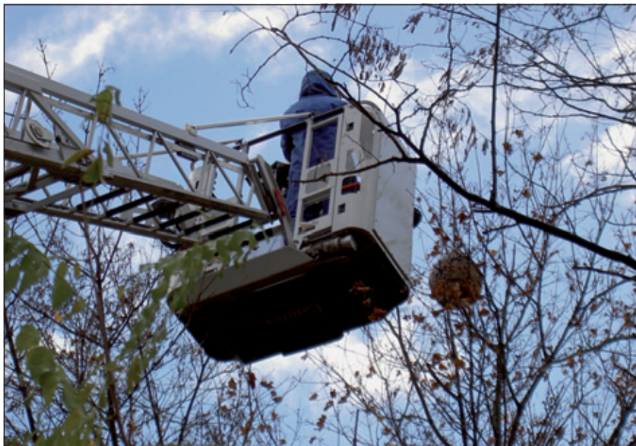
2010 : intervention des pompiers pour éradiquer un nid de frelon asiatique à Saint-Laurent-le-Minier.

localisé à l'Ouest du Gard, sur les communes de Saint-Laurent-le-Minier et Lasalle, puis en 2008 repéré sur Soudorgues, Anduze, Générargues, Mons, ainsi que dans de nombreuses autres localités avoisinantes.