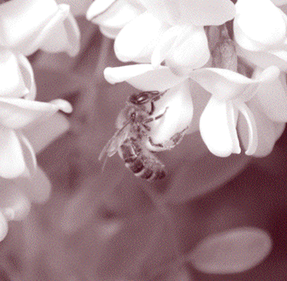
Abeja pecoreadora de acacia

actualidad se comercializan aproximadamente 5.000 productos fitosanitarios fabricados con alrededor de 450 sustancias activas (inventario realizado por la asociación francesa ACTA: Association de coordination technique agricole ).