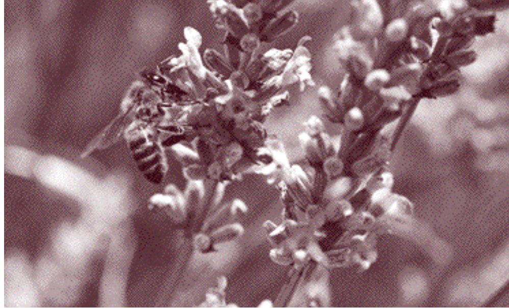
Abeja pecoreadora de lavanda

Durante la floración de plantas altamente melíferas y poliníferas puede